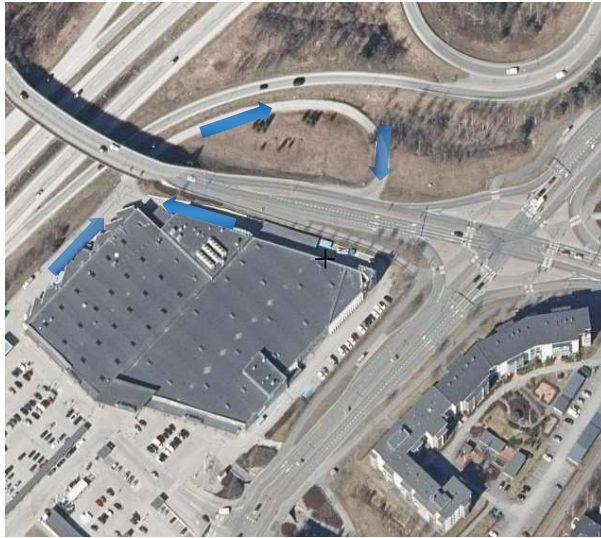
Nykytilanne ilmakuvassa. Tärkeä ulosajoreitti korostettu nuolin.

Muistutus koskee Linnainmaan raitiotiehaaran katusuunnitelmaehdotuksia, jotka ovat nähtävillä 5.-19.4.2024. Pirkanmaan Osuuskaupalla on suunnitellun raitiotielinjan vieressä Prisma-hypermarket, jonka ajoyhteyksiin on suunniteltu muutoksia.